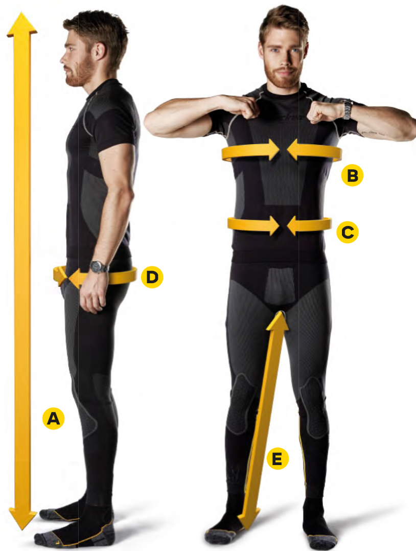
9431 XTR Body Engineered Long Johns 9432 XTR Body Engineered T-Shirt

Jedes CE-geprüfte Kleidungsstück muss mit einem Etikett mit Piktogrammen versehen sein, aus dem die Größe und die Körpermaße zu ersehen sind, für die das Kleidungsstück bestimmt ist. Im Kleidungsstück finden Sie also immer einen Hinweis auf die Größe.